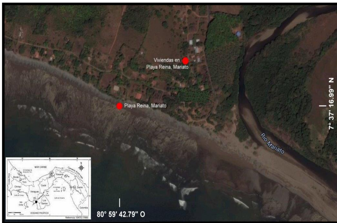
Figura 1. Coordenadas de la ubicación de playa Reina, Mariato, provincia de Veraguas, figura tomada de Google Earht (2016).